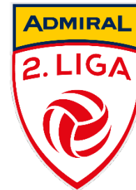
Bewerbslogo zweithöchste Spielklasse